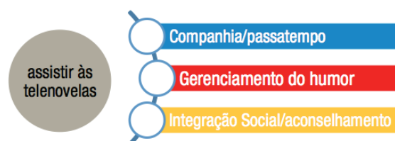
Figura 1 - Motivos para a audiência das telenovelas

Em pesquisa, foram encontrados oito diferentes motivos que conduzem o consumo das telenovelas e que puderam ser genericamente reduzidas a três. Companhia/passatempo, Escape, Relaxamento, Valorização da autoimagem, Projeção dos sonhos, Fuga do tédio, Integração social e Aprendizagem/aconselhamento foram os códigos substantivos encontrados, reduzidos aos códigos teóricos rotulados como: 1) Companhia/passatempo; 2) Gerenciamento do humor; 3) Integração social/aconselhamento.