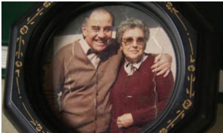
Figura 11: e sua infância com os avôs – foto de Valentina quando criança