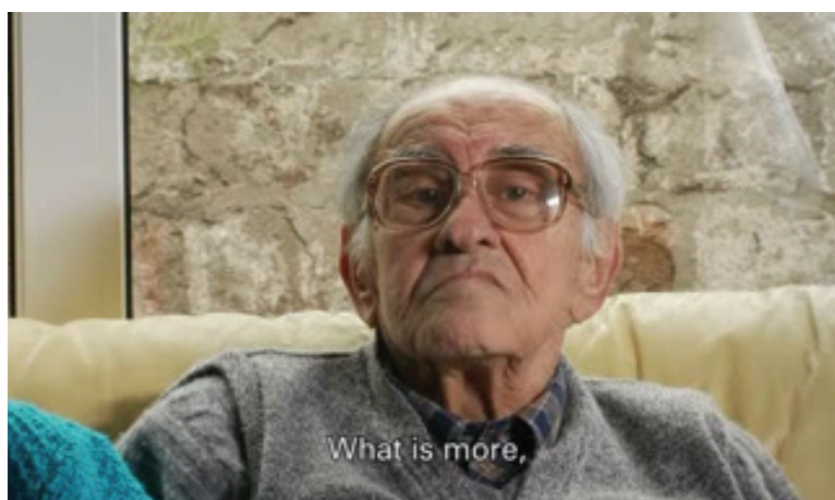
Figura 15: Mantendo o mesmo plano a câmera se desloca lateralmente...