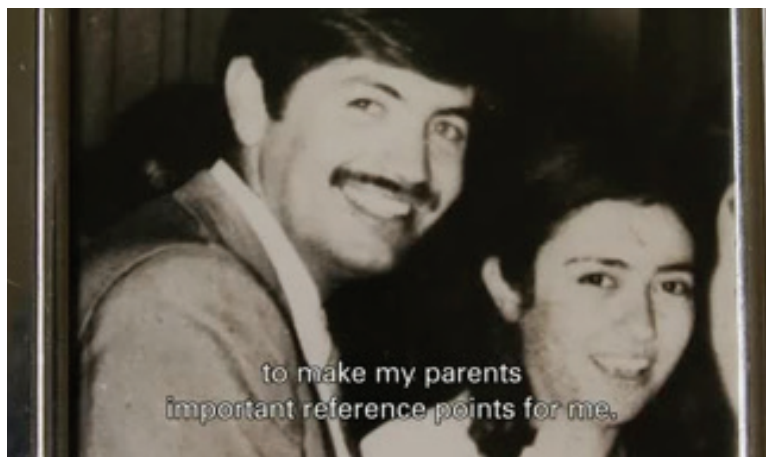
Figura 14: O avô em close