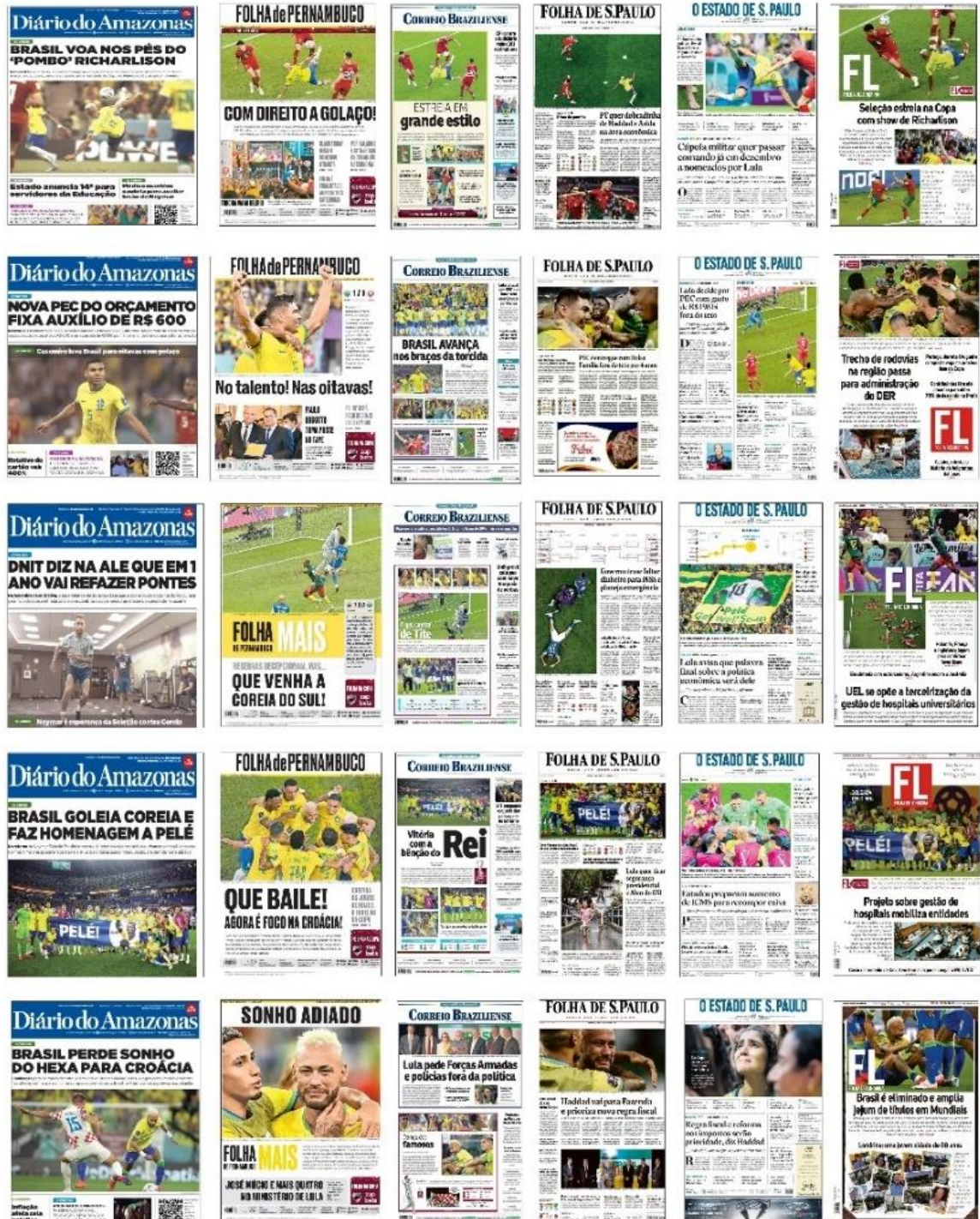
Figura 2: Capas dos Jornais Impressos